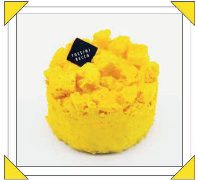
MIMOSINA € 3

Pandispagna alla vaniglia con crema chantilly