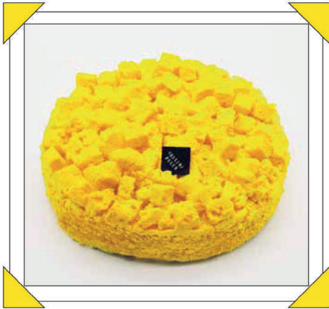
MIMOSA € 12

Pandispagna alla vaniglia con crema chantilly