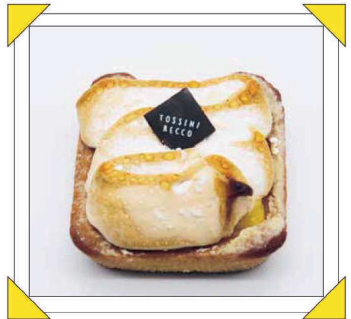
LITTLE LEMON MERINGUE PIE € 2,50

Crostata con crema al limone e meringa all'italiana morbida