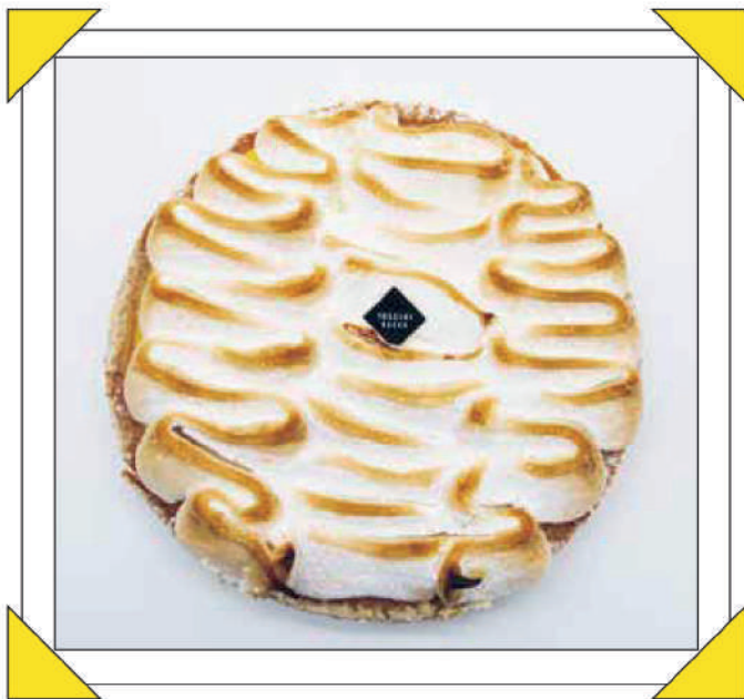
LEMON MERINGUE PIE € 12

Pandispagna alla vaniglia con crema chantilly