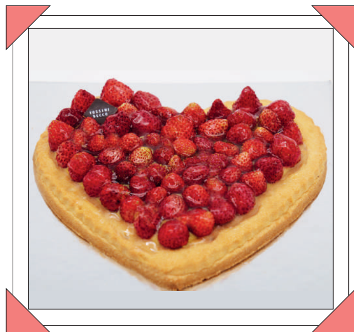
CUORE DI FRAGOLINE € 12

Pandispagna alle mandorle con crema chantilly al mango