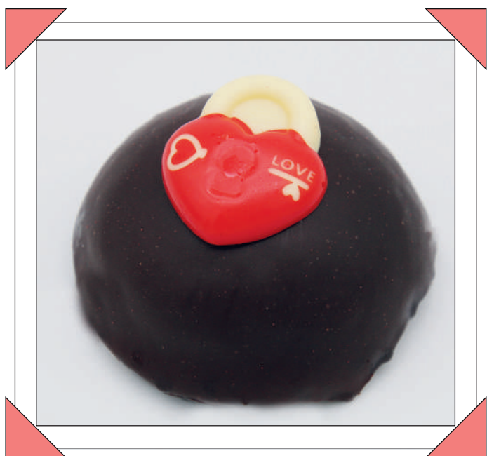
LUCCHETTO € 2,50

Crostata con crema pasticcera e fragoline di bosco