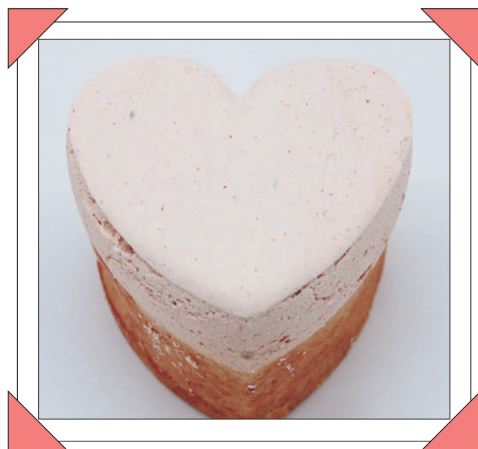
CUOR DI MERINGA € 1