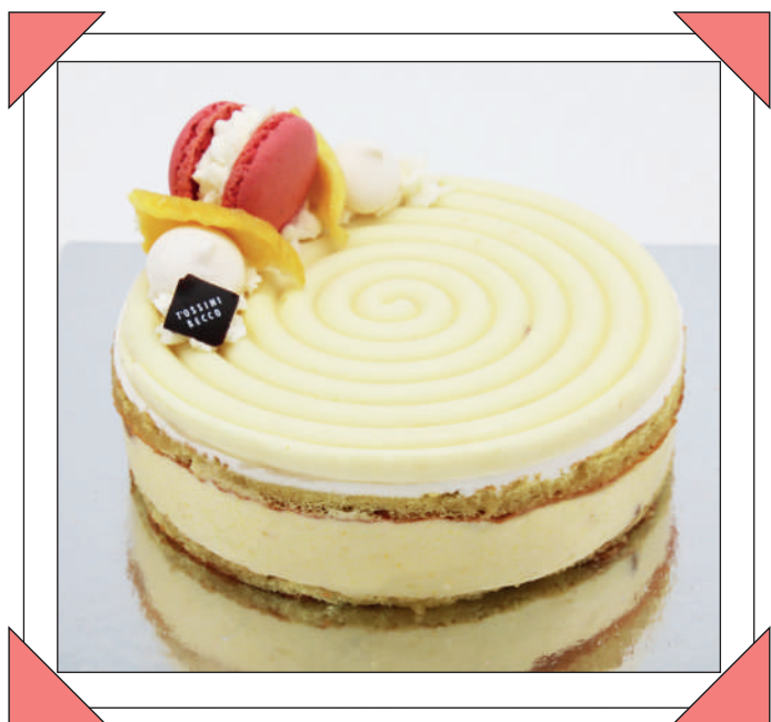
LOVE TORNADO € 12

Pandispagna alle mandorle con crema chantilly al mango